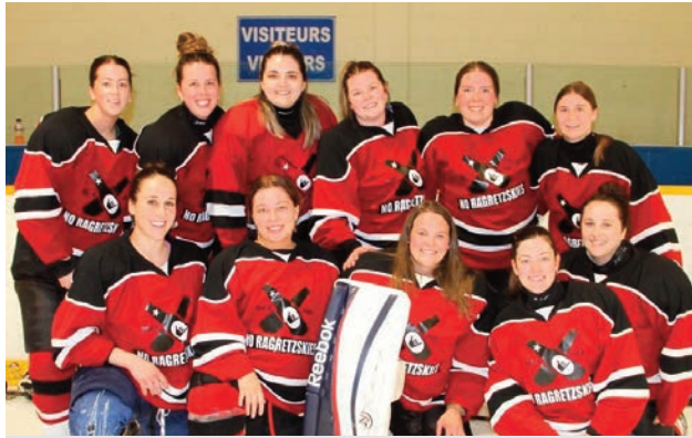
No Ragretzkies - FINALE DIVISION FA-B

exécutif. Comme d'habitude, des joutes ont été disputées du matin au soir, mais maintenant les équipes finalistes sont choisies à l'avance, au hasard, s'affrontant le dimanche après-midi pour gagner dans leur division.