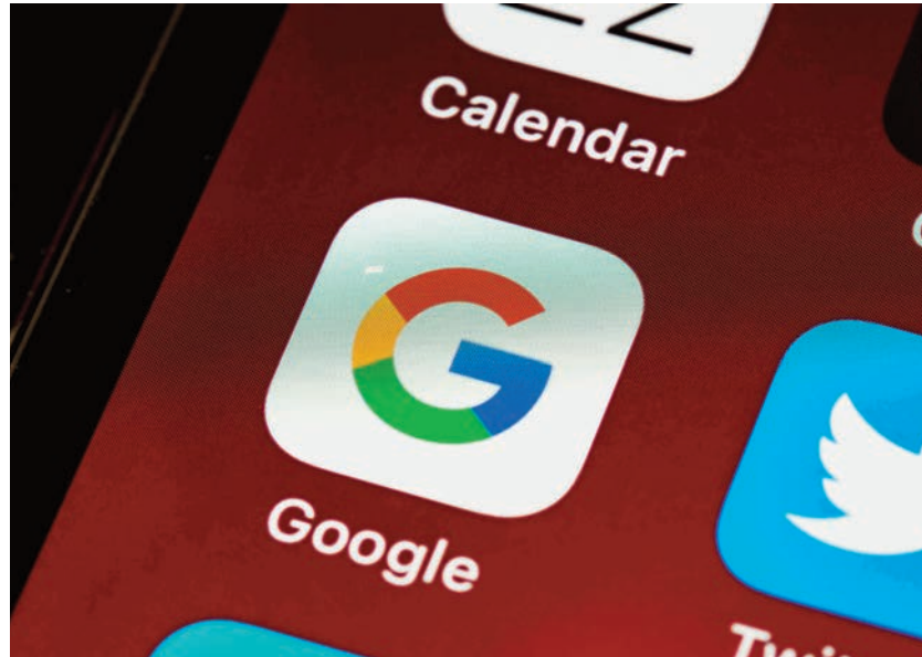
Les médias communautaires sont d'avis que la structure proposée à Google avantage les grands médias à leurs dépens.

« Si on y va au ratio en termes de membres, l'association qui rejoint les radios anglophones au Canada [...] est un petit peu plus grosse,