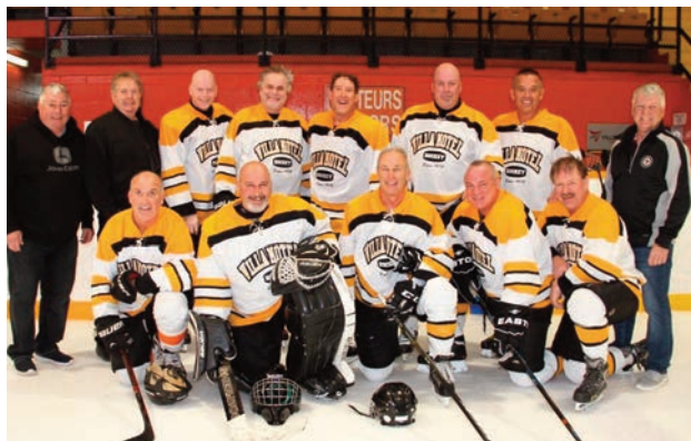
Villa Motel - FINALE DIVISION D