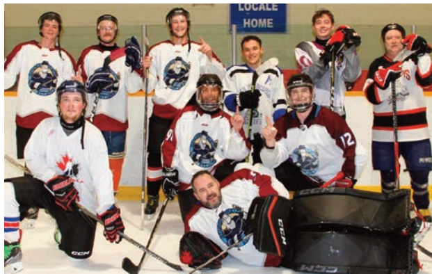
Bender Budz - FINALE DIVISION C

ABONNEZ-VOUS À NOTRE INFOLETTRE ET SOYEZ À L'AFFUT DE NOS NOUVEAUTÉS EN PREMIER.