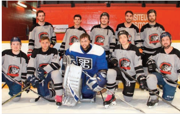
Underdogs - FINALE DIVISION B