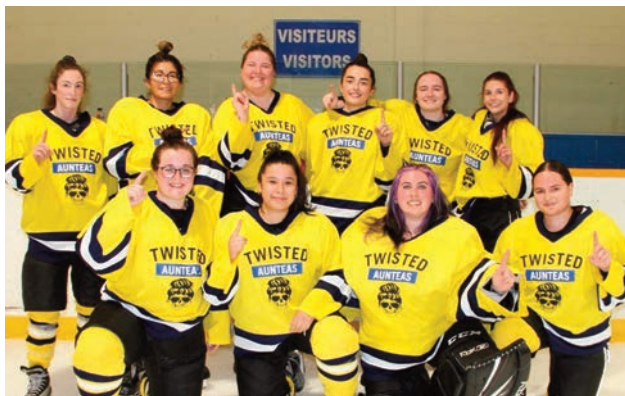
Twisted Aunteas - FINALE DIVISION FC