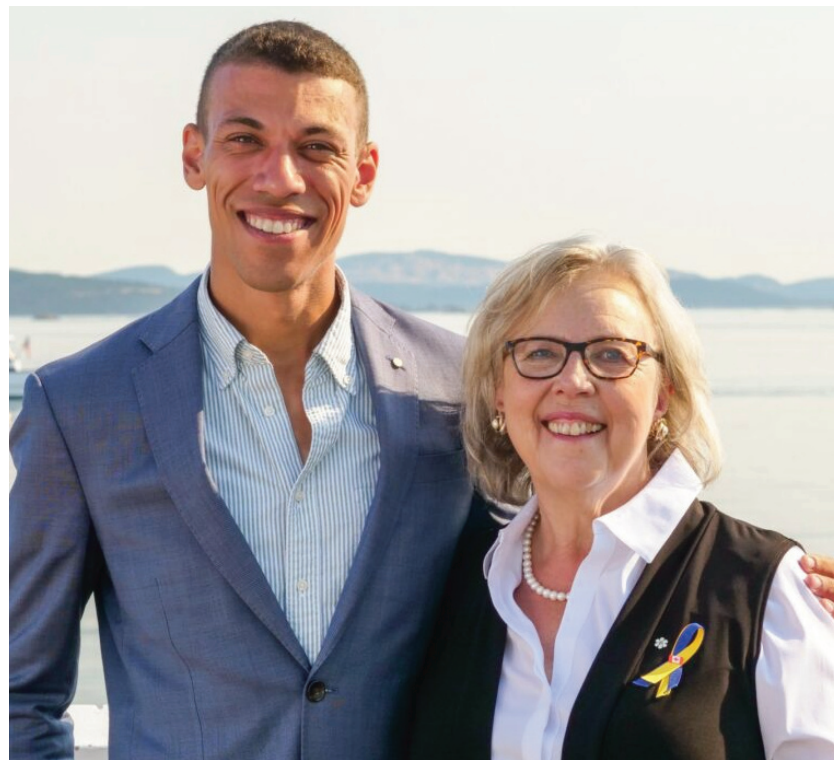
Le co-chef du Parti vert Canada, Jonathan Pedneault, pose avec la cheffe, Élisabeth May.

Un peu plus de 40 ans se sont passés depuis la création du Parti vert, mais pour devenir un parti officiel en chambre et recevoir des fonds additionnels, il doit y avoir 12 députés d'élus. « En 2019, nous avions eu au-dessus de 1 million de votes, pas très loin derrière le Bloc Québécois. Toutefois, nous avons eu trois sièges en chambre et eux avaient une trentaine de députés élus, ce qui illustre bien le