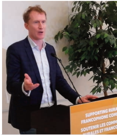
Marc Miller (à gauche), ministre de l'Immigration, des Réfugiés et de la Citoyenneté du Canada (IRCC) et Paul Lefebvre (à droite), maire de Sudbury.

Ceux-ci pourront doubler le nombre de personnes participantes, a voulu faire valoir le ministre, « en particulier si elles parlent français et veulent faire partie des communautés rurales. » Au nombre du programme rural du Nord s'ajouteront les nouveaux arrivants francophones qui auront